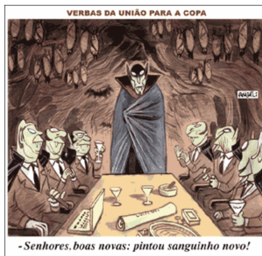
Imagem: Folha de S. Paulo 01/11/2008.

44. Sobre a charge, assinale a alternativa correta.